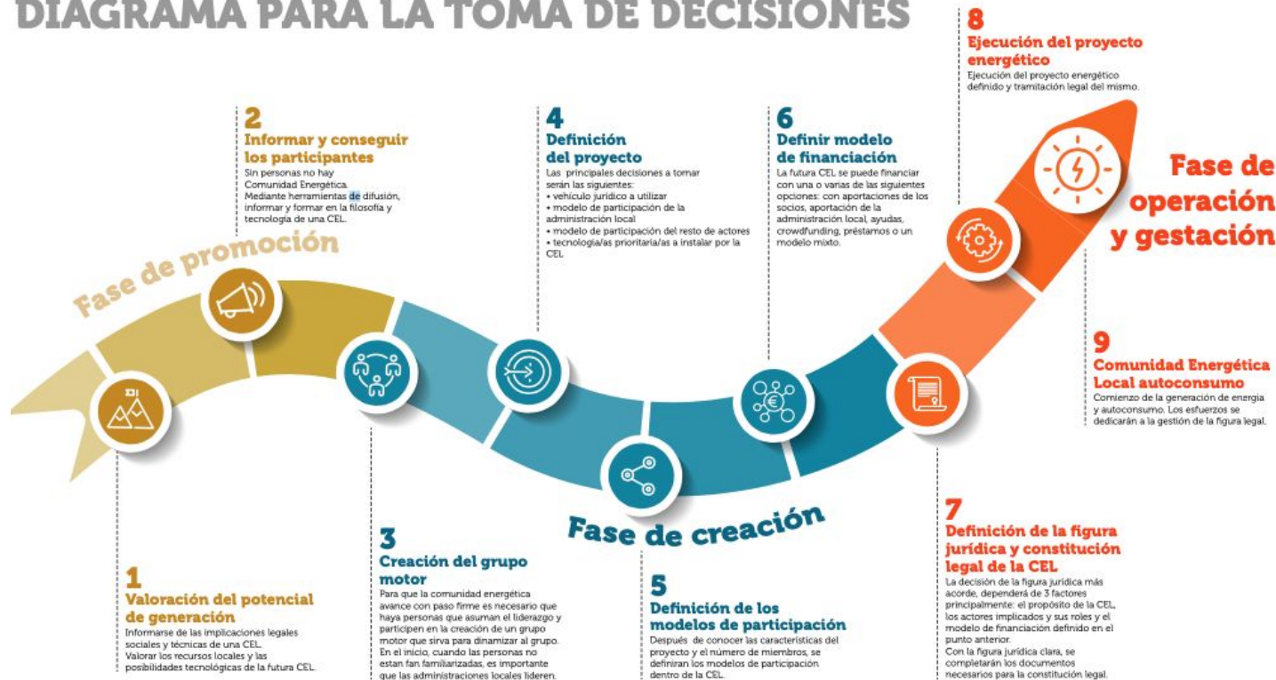
DIAGRAMA PARA LA TOMA DE DECISIONES