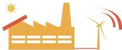
Individual en red interior