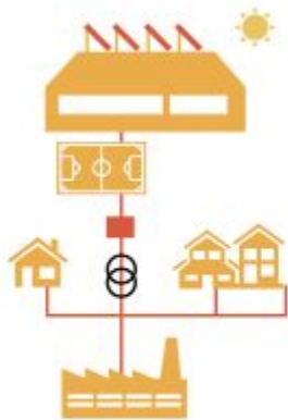
Colectivo a través de red