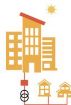
Colectivo en red interior y a través de red